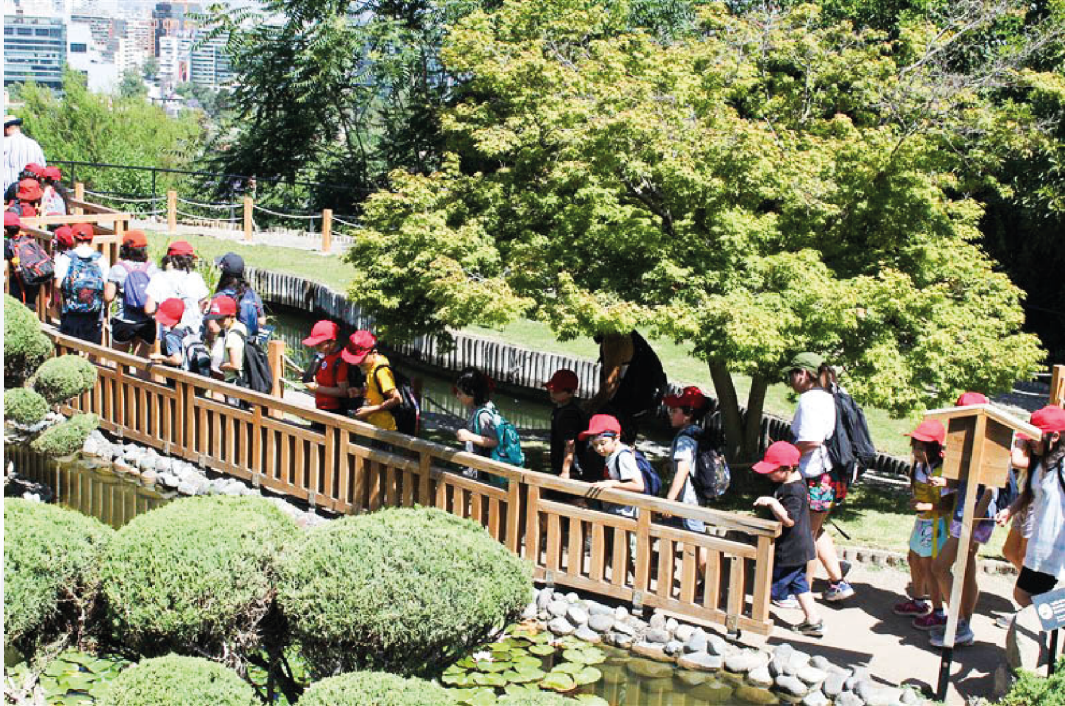
Salida Pedagógica Jardín Japonés

“El alumno es un sujeto activo, y es tarea del docente generar entornos estimulantes para desarrollar y orientar esta capacidad de actuar. De este modo, es el maestro quien debe conectar los contenidos del currículum con los intereses de los estudiantes”.