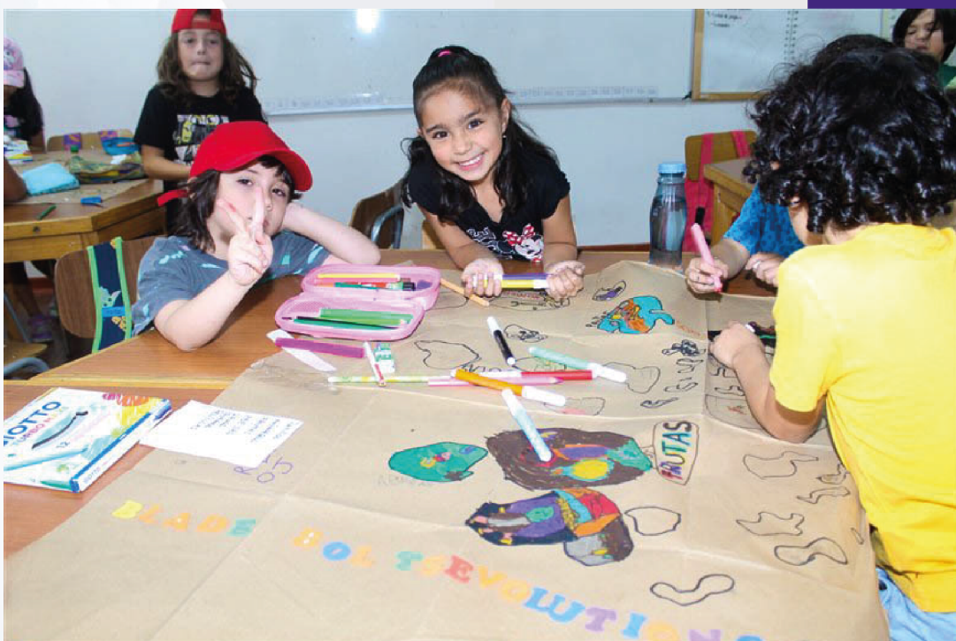
Preparación muestra de productos Jornada Tarde