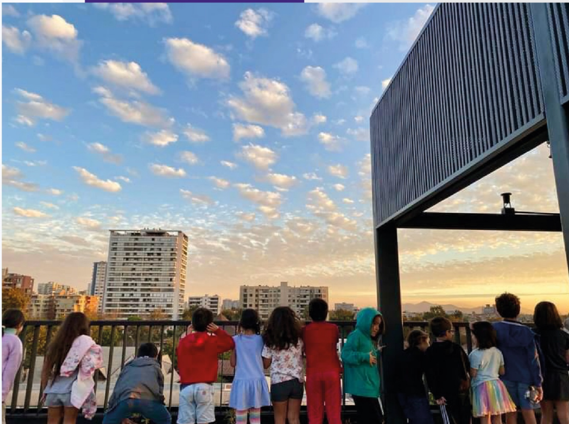
Actividades en nuestra Aula Abierta