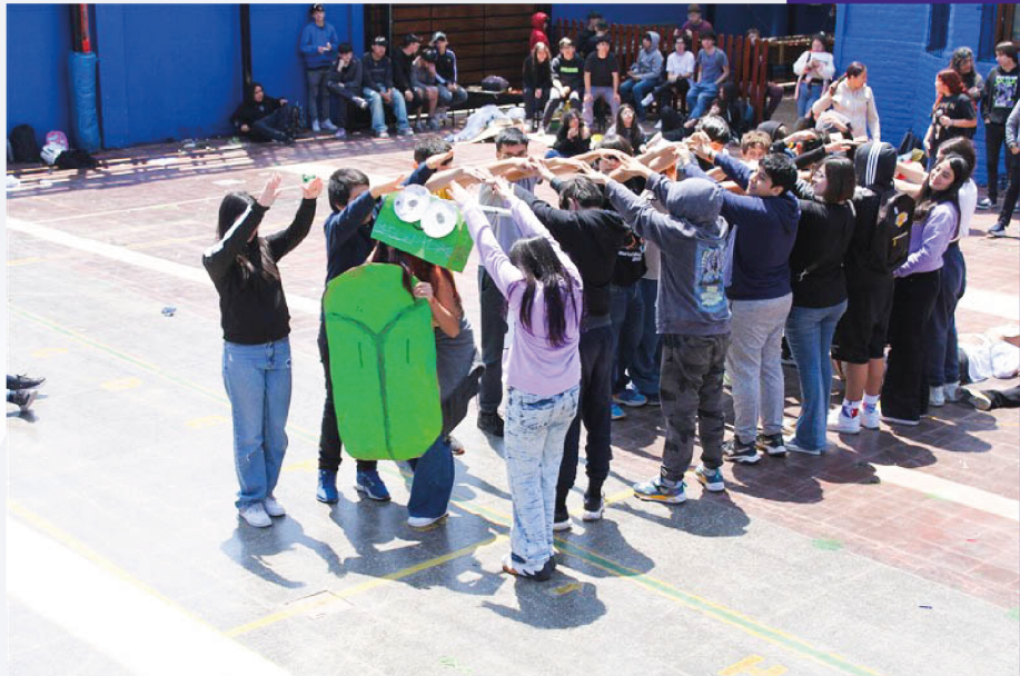
Presentación productos Jornada Mañana

“El estudio no se mide por el número de páginas leídas en una noche, ni por la cantidad de libros leídos en el semestre. Estudiar no es un acto de consumir ideas, sino de crearlas y recrearlas”.