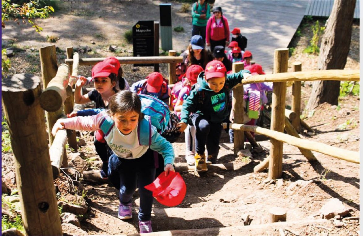
Salida Pedagógica: Trekking Parque Mahuida

“ Donde haya un árbol que plantar, plántalo tú. Donde haya un error de enmendar, enmiéndalo tú. Donde haya un esfuerzo que todos esquivan, hazlo tú. Sé tú el que aparta la piedra del camino”.