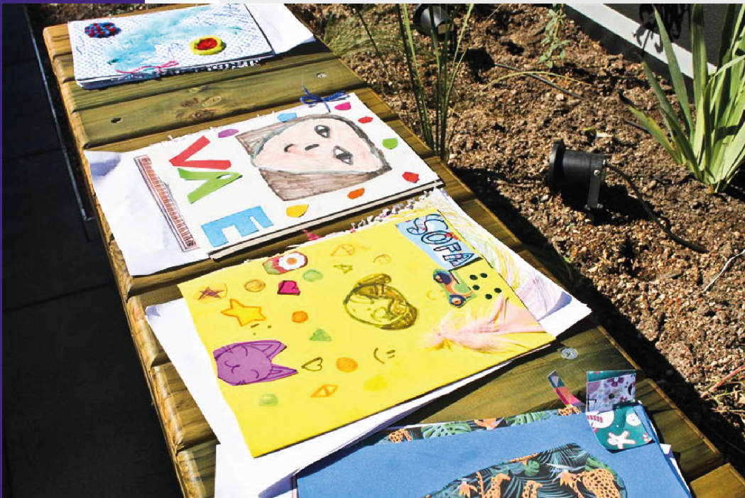
Presentación productos Jornada Tarde